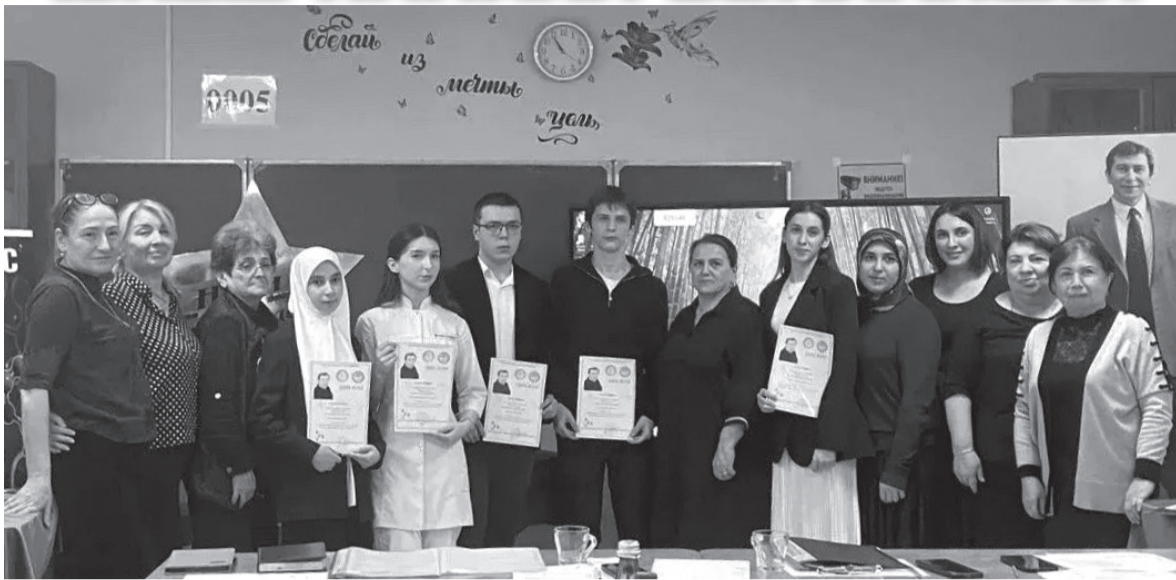
На базе СОШ №2 прошел XVI городской конкурс «Юный химик на приз Наби Магомедова».