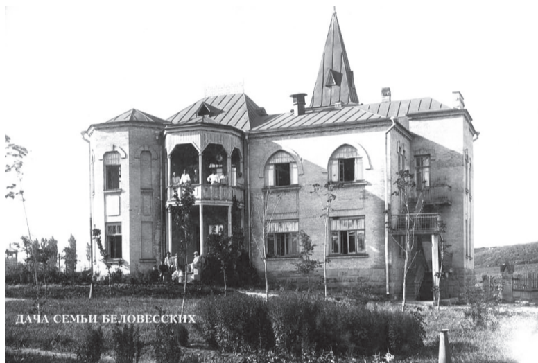
ДАЧА СЕМЬИ БЕЛОВЕСКИХ