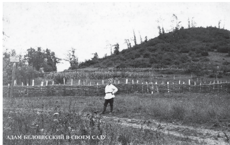
АДАМ БЕЛОВЕСКИЙ В СВОЕМ САДУ