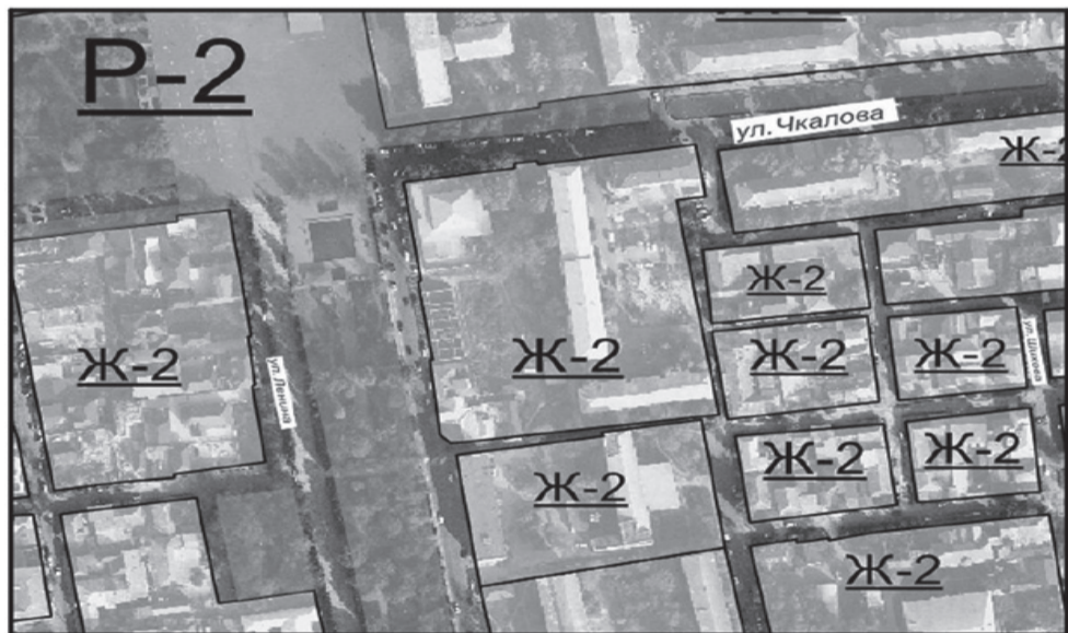
Предложение по внесению изменений в Правила землепользования и застройки городского округа «город Буйнакск». Условные обозначения:

Приложение к проекту внесения изменений в Правила землепользования и застройки городского округа «город Буйнакск» Сопоставленные фрагменты карты градостроительного зонирования Фрагмент Правил землепользования и застройки городского округа «город Буйнакск», утвержденных 12.03.2014 г.